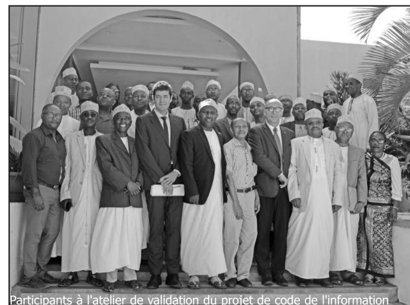
Participants à l'atelier de validation du projet de code de l'information