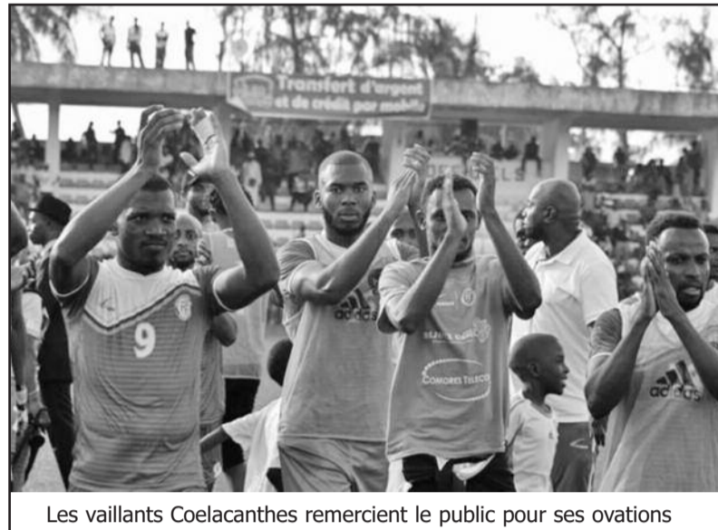
Les vaillants Coelacanthos remercient le public pour ses ovations

Sur le niveau des Mourabitounes, notre interlocuteur enchaîne : « Nous avons un sélectionneur qui bosse beaucoup. Il est conscient que l'adversaire, qui a battu de grandes équipes, est en progression. Il y a 5 ans de cela, il occupait la 198e place de la Fifa. Aujourd'hui, il respire à la 90e, loin devant nous (140e) ou presque. Le match était difficile, compte tenu