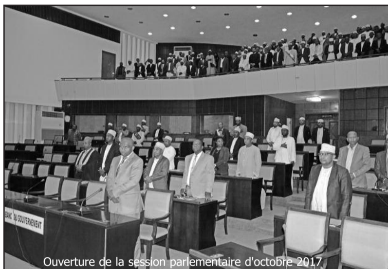
Ouverture de la session parlementaire d'octobre 2017

M. Ousseni citant un rapport du Fmi très alarmiste au niveau de certains indicateurs l'endettement, les