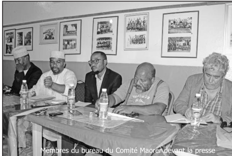
Membres du bureau du Comité Maoré devant la presse

Le Comité Maoré demande aussi la dissolution du Haut Comité Paritaire (HCP) qui selon eux ne